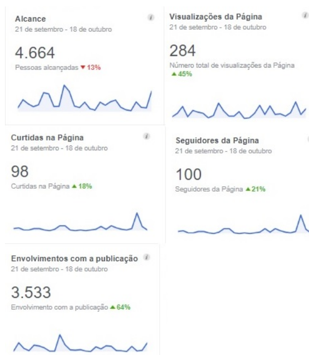
Figura 2: Resumo de informações do Facebook [5] (período 21 de setembro a 18 de outubro de 2018) utilizadas no cálculo da taxa de envolvimento, onde Alcance (nº de telas que exibiu qualquer publicação da Página), Visualizações na Página (nº de vezes que o perfil da Página foi visualizado), Curtidas na Página (número de novas pessoas que curtiram a Página), Seguidores da Página (nº de novas pessoas que começaram a seguir a Página) e Envolvimentos com a publicação (nº de pessoas que interagiram com as publicações por meio de curtidas, comentários, etc.).

As maiores taxas de envolvimento (de até 40%) ocorreram no final do período analisado (meados de setembro/2018 a meados de outubro/2018) e em grande parte com publicações que envolveram atividades do pessoal da OBT.