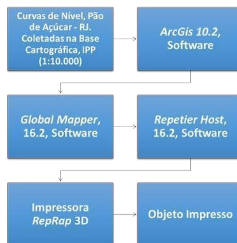
Figura 1. Fluxograma Metodológico

16.2 para realização de conversão em formato STL, que se trata de um tipo de arquivo universal para impressão 3D (Figura 2).