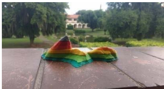
Figura 3. Pão de Açúcar impressora 3D em Curvas de Nível