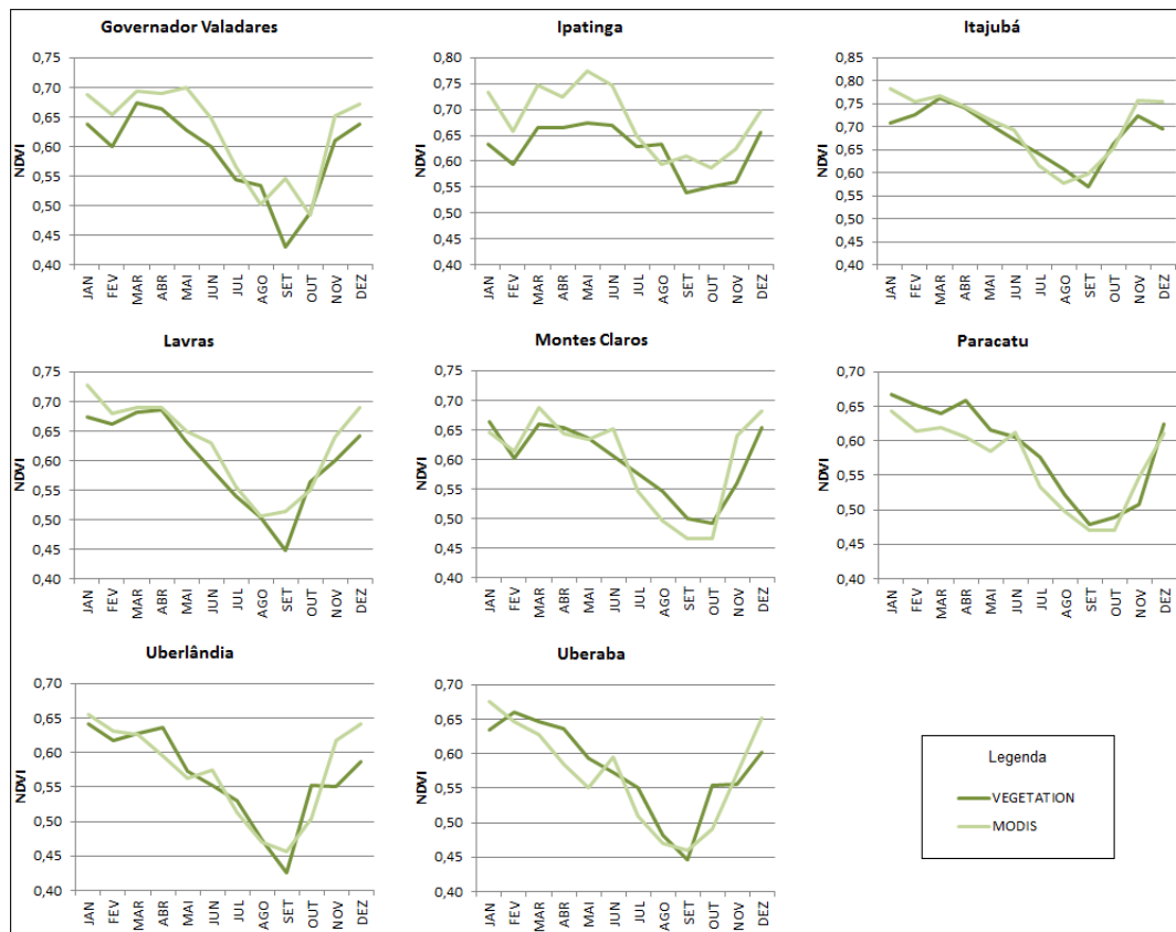
Figura 2. Perfis temporais de NDVI obtidos a partir dos sensores MODIS/TERRA e VEGETATION-2/SPOT para os municípios estudados.

Comparando os produtos dos dois sensores, nota-se que o NDVI originado do MODIS apresentou maiores valores em seis dos oito municípios estudados em quase todos os meses do ano (exceto Paracatu e Uberaba, onde o VEGETATION-2 apresentou estes maiores valores durante a maior parte do período). Também é possível constatar que, exceto no município de Paracatu, o MODIS também apresentou os maiores picos do índice, como mostra a Figura 2.