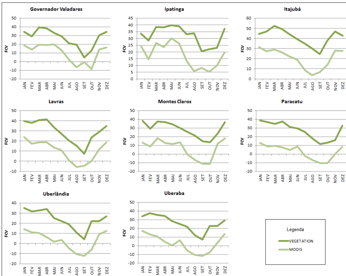
Figura 3. Perfis temporais de FCV obtidos com os sensores MODIS/TERRA e VEGETATION-2/SPOT para os municípios estudados.

Em contrapartida, diferentemente do NDVI, os valores de Fração de Cobertura Vegetal obtidos através do sensor MODIS foram invariavelmente menores do que os obtidos através do VEGETATION-2 durante todo o período de análise em todos os municípios analisados, como mostra a Figura 3.