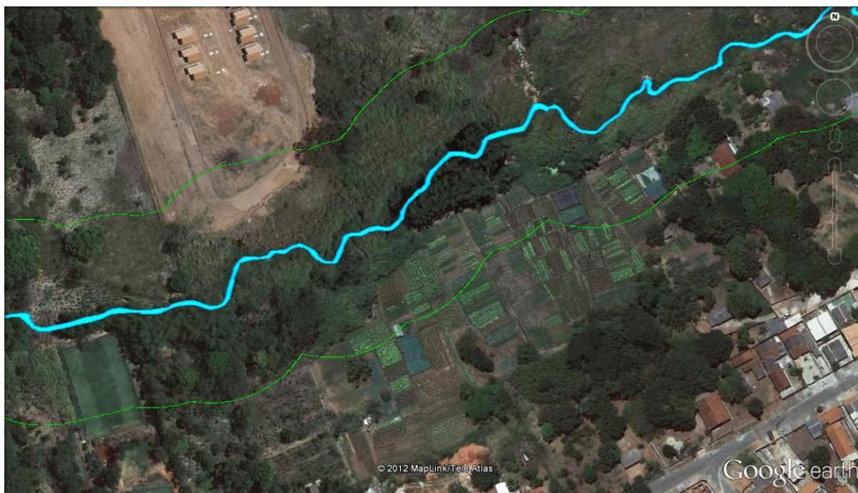
Figura 3. Área desmatada para cultivo de agricultura intraurbana.