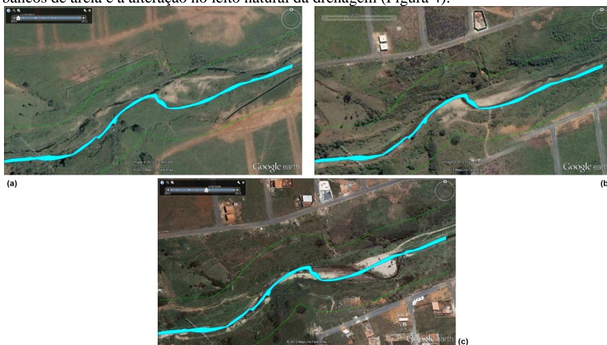
Figura 5. Trecho do córrego Água Branca nos anos de 2003(a), 2006(b) e 2008(c).

o curso da drenagem. Observando os anos de 2003, 2006 e 2008 observa-se o acúmulo de bancos de areia e a alteração no leito natural da drenagem (Figura 4).