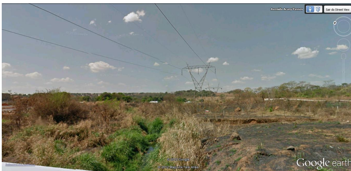
Figura 4. Área desmata e com indícios de queimada às margens do córrego Água Branca visualizada através do street view

Evidenciou-se que as áreas de preservação permanente sofrem diversos impactos resultantes principalmente da falta de planejamento. O despejo de resíduos provenientes da construção civil, lançados em locais indevidos, ocasiona poluição e degradação ambiental (SANTOS, 2009). Outro problema é a presença de agriculturas intra-urbanas, ocasionando escoamento de fertilizantes e agrotóxicos para o curso de água, o que potencializa, dentre outros problemas, a contaminação e eutrofização dos ambientes aquáticos (VALENTE et al, 1997).