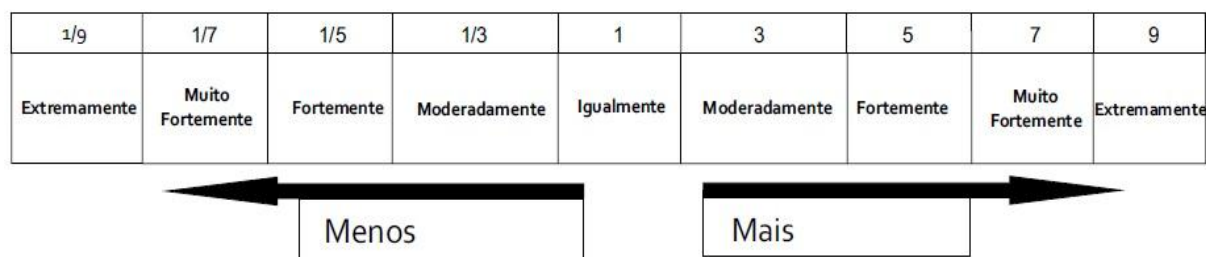
Figura 2. Escala de nove pontos para a comparação pareada entre fatores.

Dessa forma, cada uma das células da matriz é preenchida com um valor de julgamento que expressa a importância relativa entre pares de fatores (NICOLETE; ZIMBACK, 2013). Os valores então são derivados de uma escala contínua de nove pontos (Figura 2).