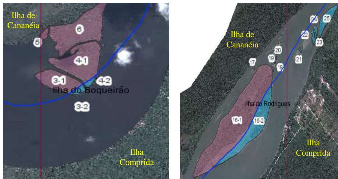
Figura 2. Linha divisória das ilhas do Mar Pequeno e sua rotulagem (Exemplo: 3-1 e 3-2).

Para a proposta do domínio das ilhas existentes no Mar Pequeno, foi adotado o seguinte critério: “as porções oriundas da divisão das ilhas pela linha que divide o álveo ao meio concomitante ao agrupamento das ilhas que formam um arquipélago”. Esta relação foi utilizada para interagir com o critério da Lei Estadual nº 5.439, de 9 de setembro de 1959, em função deste documento ter sido utilizado para definir a jurisdição das ilhas do Rio Grande, na divisa entre os estados de São Paulo e Minas Gerais, e até hoje ser utilizado como referência para esse fim.