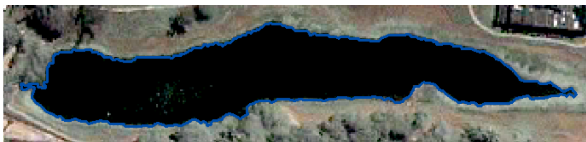
Figura 6. Sobreposição da Vetorização Manual (em azul) com a imagem original

extraída dependerá apenas da acurácia visual do operador. Dependendo do que se deseja extrair o serviço torna-se um tanto oneroso.