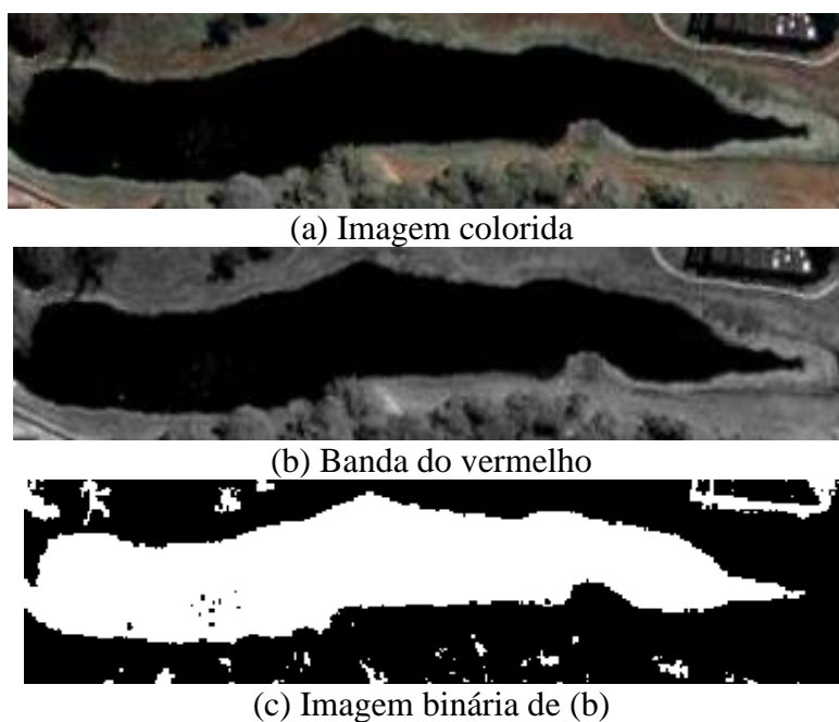
Figura 3. Resultado da binarização do Lago do Cavouco no software SPRING.

A binarização da imagem no SPRING foi realizada utilizando a ferramenta de edição de contraste onde podemos manipulá-lo através da edição de pontos do histograma, entrando intervalo de binarização. Encontrar este intervalo de binarização requer um conhecimento prévio do comportamento espectral do alvo, e utilizar a banda onde exista o maior contraste entre o alvo desejado e os demais. Neste caso utilizou-se a banda do vermelho da imagem da Figura 2, pois a imagem usada estava em composição RGB na faixa do visível. O resultado da binarização é visualizado na figura 3.