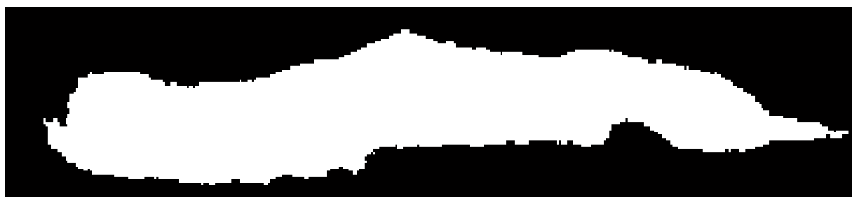
Figura 4. Imagem do Lago do Cavouco no software Matlab sem ruídos

Observou-se pela Figura 3, que a binarização no SPRING fez uma confusão entre a água e as sombras das árvores e prédios, então como no SPRING versão 5.06, não possui uma ferramenta em que selecione o alvo de interesse, fez-se necessário levar a imagem binarizada para o software Matlab a fim de selecionar apenas o Lago e realizar na imagem a extração de bordas usando as ferramentas da morfologia matemática. Com a utilização do algoritmo implementado no Matlab que usa a função pré-definida bwselect , foi selecionado o objeto de interesse, no caso, o lago da figura 4.