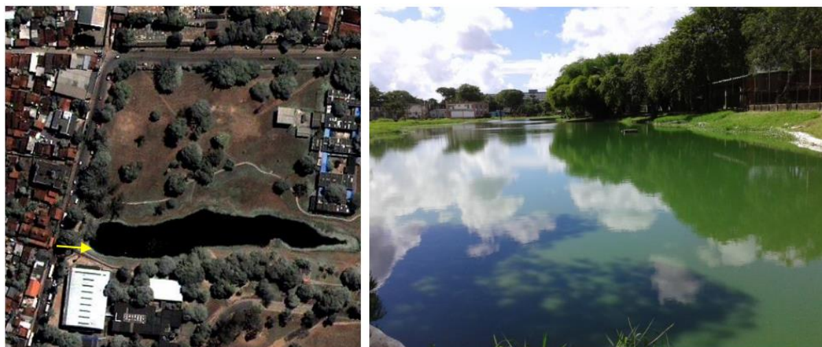
Figura 2. Área de Estudo. (a) Recorte de uma imagem IKONOS-2 do campus da UFPE com data de aquisição de 15/04/2013. (b) Fotografia obtida da área em 04/07/2014 e indicada na imagem (Figura 2(a)) pela seta amarela.