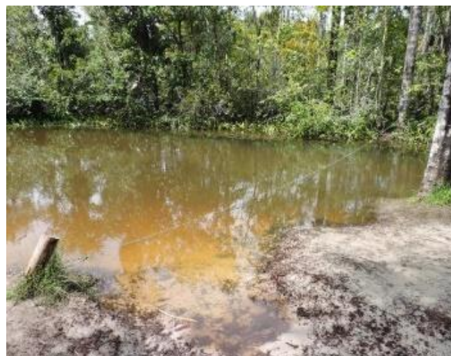
Figura 3. Escoamento superficial poluindo a água e local de represamento e água parada por conta do ramal

risco de erosão e perda gradual da fertilidade do solo, ocasionando o seu empobrecimento, e conseqüentemente ameaça os recursos hídricos da região, além de promover o assoreamento dos rios, havendo a possibilidade da contaminação por agrotóxicos utilizados em plantações ou produtos utilizados durante a remoção de areia.