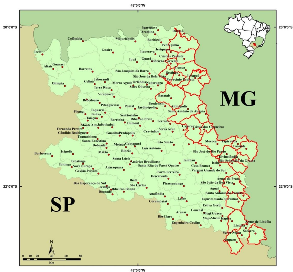
Figura 1. Mapa da área de estudo com os 126 municípios paulistas das bacias hidrográficas dos rios Mogi-Guaçu e Pardo. Os 26 municípios com a área delimitada em vermelho localizam-se na Mogiana paulista e são os principais produtores de café da região.

Inseridos nessas bacias estão 26 municípios localizados no leste paulista e pertencentes a região da Mogiana paulista. Nesses 26 municípios avaliou-se a mudança de uso e cobertura da terra nos anos de 1988 e 2015. Esses 26 municípios são os principais produtores de café e os únicos a possuírem área de café superior a mil hectares na área das duas bacias. Os municípios em ordem decrescente de produção de café são: Pedregulho, Caconde, Franca, Cristais Paulista, Altinópolis, Ribeirão Corrente, São S. da Gramma, Espírito S. do Pinhal, Patrocínio Paulista, Itirapuã, Santo A. do Jardim, São J. da Boa Vista, Batatais, Tapiratiba, Jequiera, Serra Negra, Santo A. da Alegria, Cajuru, Restinga, Mococa, Socorro, Cássia dos Coqueiros, São J. do Rio Pardo, Itapira, São J. da Bela Vista e Amparo. Todos esses municípios estão delimitados em vermelho no mapa da Figura 1.