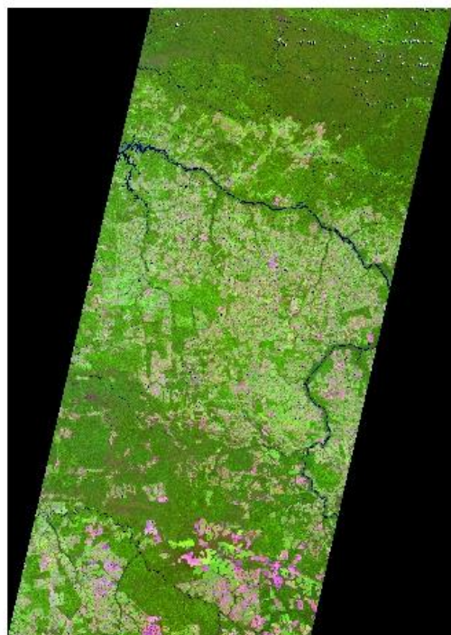
Figura 2. Mosaico das imagens do sensor Liss3.

Após a composição em cor verdadeira, foi gerado o mosaico das imagens, conforme a imagem 2 e deste mosaico recortado o limite no município de Alta Floresta-MT. Com o objetivo de extrair as áreas de plantio de teca, realizou a interpretação visual das imagens e aplicado a classificação MaxVer (Máxima Verossimilhança). Utilizando a edição Raster to polygon do software ArcGis 10.1, foram gerados os dados em polígonos. Como resultado foi possível quantificar área plantada no município.