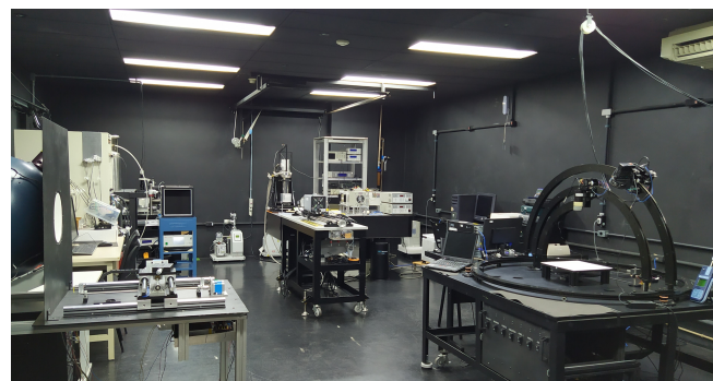
Figura 2: Laboratório de Caracterização de Sensores Eletro-ópticos - LaRaC

Portanto, devido aos requisitos de localização, já citados